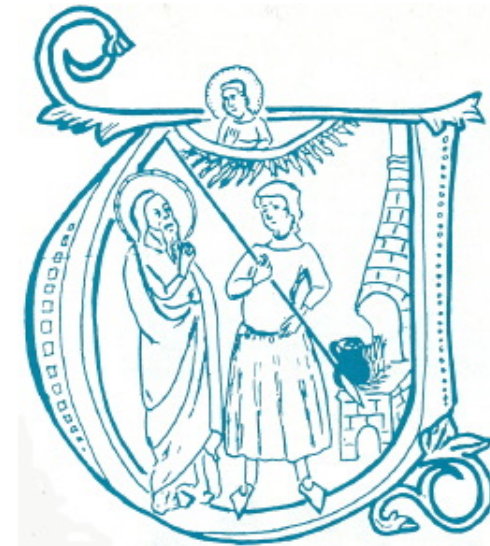
ارمیا نزد کوزه گر.

اما در این روایت این مسئله ای مطرح می شود که ارمیا چگونه توانسته دوبار به این مسافت ۱۲۰۰ کیلومتری تا رود فرات تن در دهد؟ شاید او نام رود را به بازی گرفته است و منظورش، پرات (به زبان عبری) بوده است که نام دره ای در چند کیلومتری عناتوت یا همان «عین فرا» ی کنونی می باشد. در هر حال بابل عامل اصلی انحطاط اسرائیل است و بعدها بنی اسرائیل به آنجا تبعید خواهند شد.