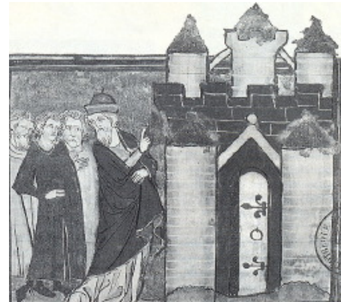
ارمیا شهر بابل را به یهودیان اسیر نشان می دهد که می بایستی به آنجا برده شوند.

آنچه ارمیا همانند تنها راه حل ممکن پیش بینی کرده بود روزی تبدیل به یقین خواهد شد. در یکی از شبهای بهاری سال ۳۰، عیسی در خانه ای در اورشلیم طی آخرین شام خود به دوستانش خواهد گفت: این پیاله عهد جدید است در خون من. هرگاه این را بنوشید به یادگاری من بجا آرید (اول قرنیتیان ۱۱: ۲۵).