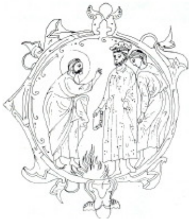
پادشاه یهوایقیم نوشته‌های ارمیا را می‌سوزاند تصویر برگرفته شده از کتاب مقدس ژرون

یهوآآز پسر یوشیا پس از سه ماه سلطنت توسط یکی از برادرانش، یهوایقیم خلع شد. اما یهوایقیم نیز خیلی زود خود را خراجگذار نبوکدنصر اعلام داشت. یکی از سخنرانیهای ارمیا در معبد فاجعه به بار آورد و چنانچه یکی از وزرای شاه از ارمیا حمایت نمی‌کرد او جانش را بر سر این موعظه از دست می‌داد (باب ۷ و ۲۶). شاه از پیام نبی خوشش نیامد چرا که بی‌عدالتیهای شاه و مسئولین و