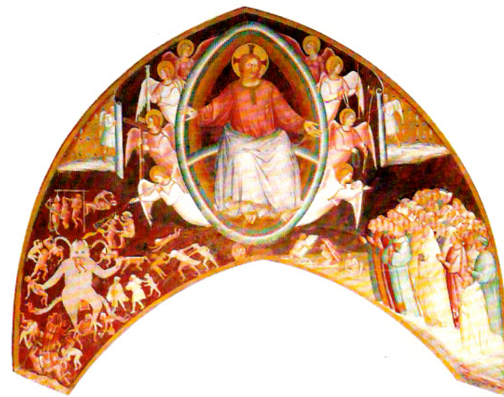
داوری جهانی و پدران قدیس، جیوستود ویبولدونه، میلان - ایتالیا

شرح تصویر بالای صفحه ۱۳: مسئولیت یک ویژگی بزرگسال نیست. این کودک که چتر به دست گرفته تا همراهش را پناه دهد، با غرور این مسئولیت را به عهده گرفته، چون با این عمل، وجود خود و قابلیت خود در کمک به دیگران را ابراز می‌کند.