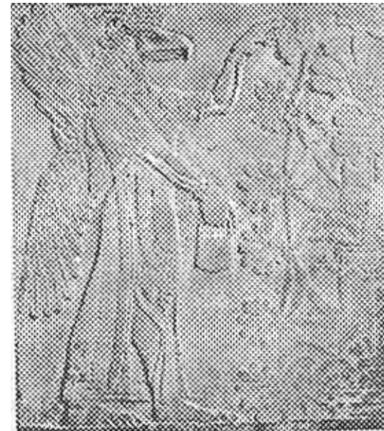
الهه آشوری در حال محافظت از درخت مقدس ( موزه لوور )

سرانجام تشبیهات پر قدرتی از شبانان به عمل آمده. شبانان به اسرائیل او را به سوی ویرانی و پراکندگی برده اند (۱/۳۴ - ۹). شبانان نیکو، خود خداوند گله اش را به مرتعهای نیکو برده و از گوسفند زخمی مراقبت می نماید (۱۰/۳۴ - ۱۶). او به کمک حیوانات بیمار می آید و در مقابل حیوانات فربه از ایشان دفاع می کند. او میان بزها و قوچها داوری می نماید (۱۷/۳۴ - ۲۲). او گله خود را تحت رهبری داور جمع آوری می کند (۲۳/۳۴ - ۲۴) و با وی عهد سلامتی می بندد تا او دوباره در امنیت در کشور ساکن شود (۲۵/۳۴ - ۳۰). «و خداوند بیهوه می گوید شما ای گله من و ای گوسفندان مرتع من انسان هستید و من خدای شما می باشم» (۳۱/۳۴). خوانندگان مسیحی این متن بدون زحمتی می توانند تشبیهاتی؟ عیسی در مثلهای خود به کار می برده در این متن باز شناسند.